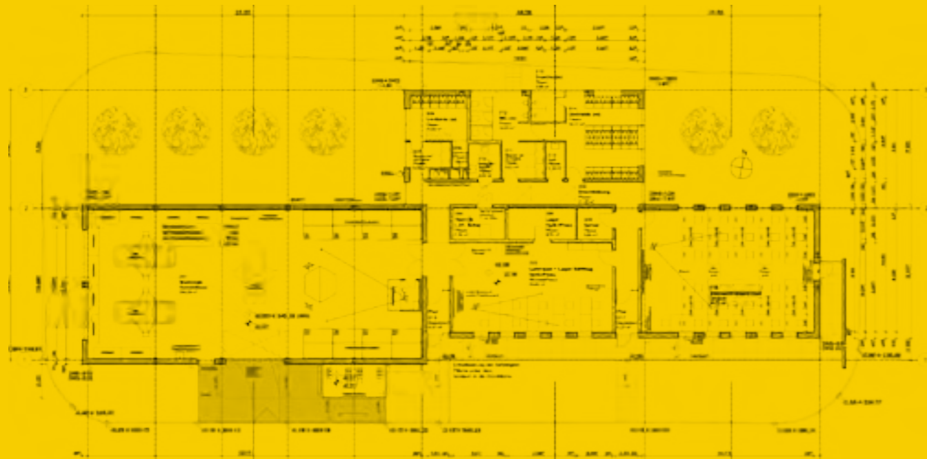
Grundriss der neuen Werkstatt im Ausbildungszentrum Infanterie in Hammelburg. Zwei Millionen Euro kostet die Erweiterung. Der Bau soll 2018 fertig sein – und damit im Unterschied zu vielen anderen Projekten im Zeitrahmen

Bauverwaltungen der Bundesländer. Diese hätten sich nur schwer auf den Personalbedarf einstellen können, weil die Ausgaben des Bundes für den Bau militärischer Liegenschaften seit Jahren schwanken. Um das Problem anzugehen, hat die Bundeswehr 2016 ein Sofortprogramm zur Sanierung von Kasernen ins Leben gerufen. Das Programm soll für eine bessere Abstimmung zwischen Bund und Ländern, mehr Personal in den Bauämtern und einheitliche Abläufe sorgen, beispielsweise bei der Planung von Unterkunftsgebäuden.