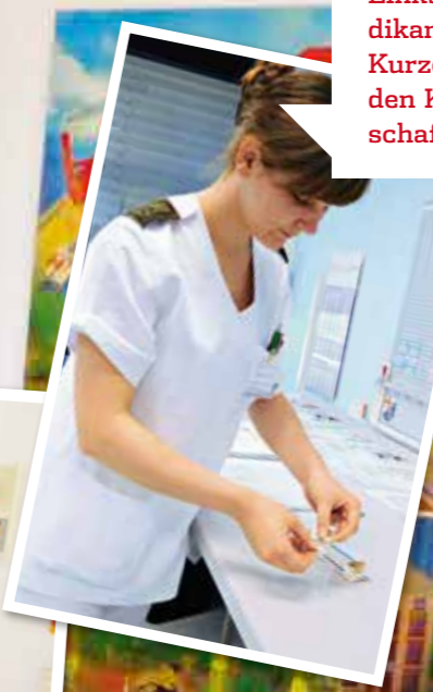
Links: Ich bereite Medikamente vor. Rechts: Kurze Mittagspause mit den Kollegen im Gemeinschaftsraum