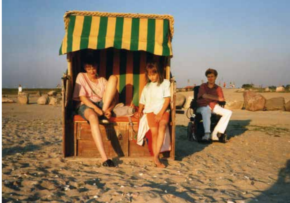
Julikas schönste Zeit: der Strandurlaub an der Ostsee (mit der Kusine)

Informationen und versuchen, die Jugendlichen anzusprechen. Aber sie erwischen fast nur die Ehemaligen. Die Initiative „Wir pflegen“ will es bald dort versuchen, wo Jugendliche am häufigsten sind: in den Schulen.