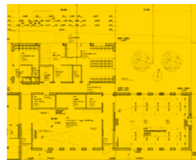
FOTOS: STAÄTLICHES BAUAMT SCHWEINFURT, PLANUNG: ARCHITEKTURBÜRO HESSDÖRFER SEIFERT ARCHITEKTEN BDA / PRIVAT / DPA, ANDREAS GEBERT

8 „Aber geplant ist das“: Die Bauvorhaben der Bundeswehr