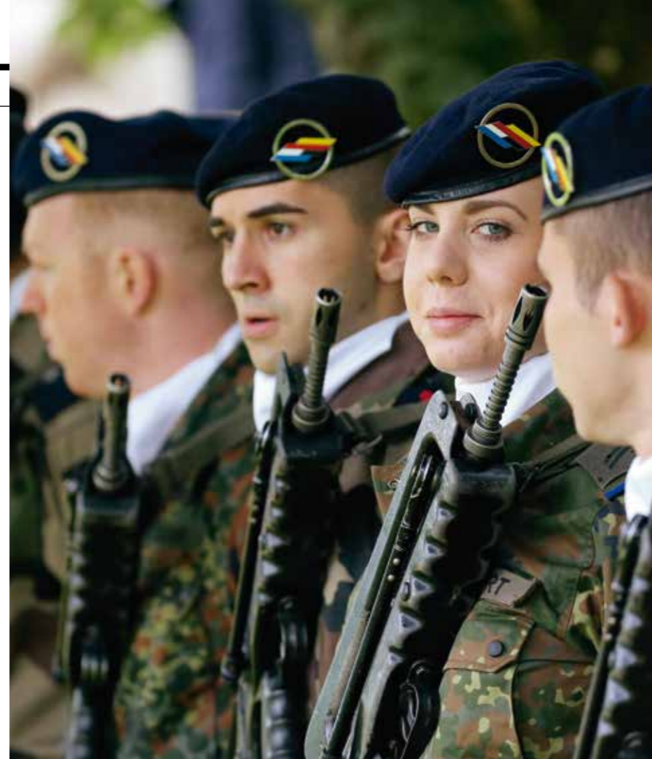
Symbol der europäischen Gemeinschaft: Soldaten der deutsch-französischen Brigade

ist auch vom Auftreten und Umgang mit Menschen abhängig. Helfen könnte ein klärendes Gespräch von Kamerad zu Kamerad. Bewirkt das nichts, dann eben von OSG zu G. Dabei könnten Sie auch die Vertrauensperson mit ins Boot holen oder sich schließlich an den Spieß oder Kasernenfeldwebel wenden.