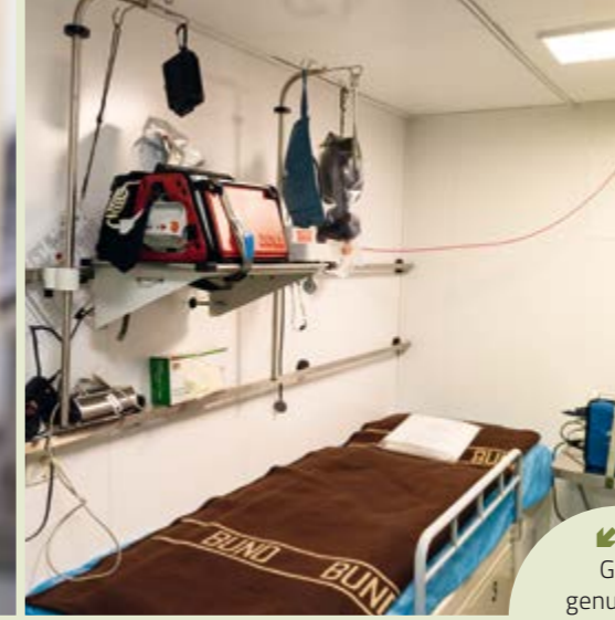
↕ Gut genutzter Stauraum und mein Arzneischränk