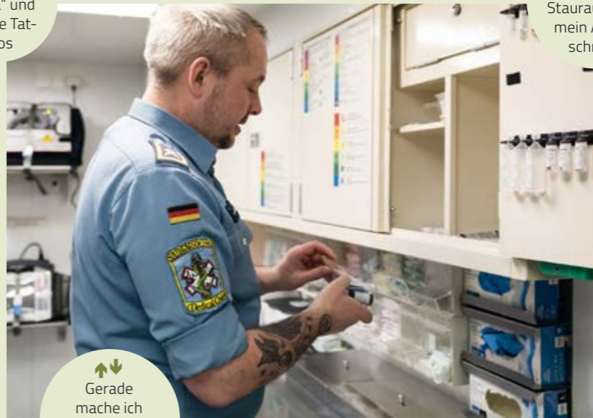
↕ Gerade mache ich Inventur, sortiere altes Material aus