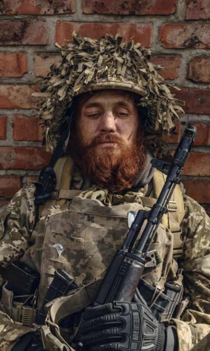
Ein Infanterist der ukrainischen Armee wartet auf seinen Einsatz an der Front