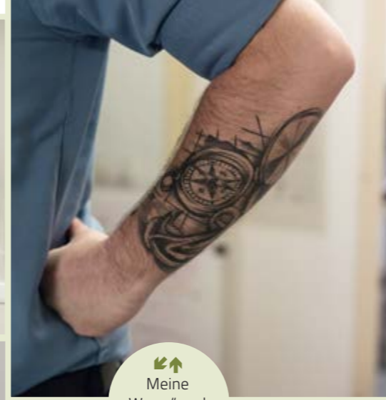
↕ Meine „Werra“ und meine Tattoos