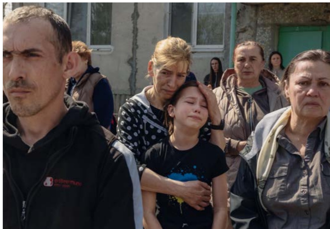
Trauerfeier für eine Familie, die 2025 bei einem russischen Angriff nahe der Stadt Sumy getötet wurde