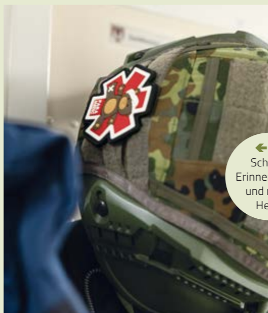
↔ Schöne Erinnerungen und mein Helm