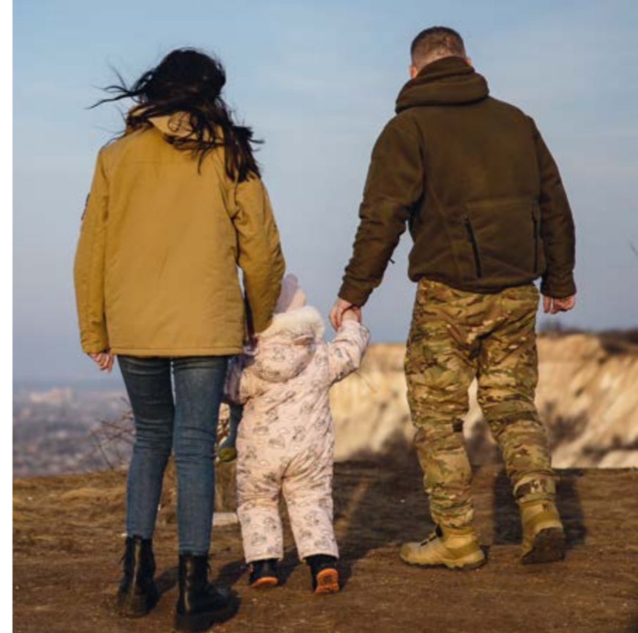
Wenig gemeinsame Zeit für die Familie: ein Soldat auf Fronturlaub im Bezirk Donezk

Das eigentliche Ausmaß des Leides werde sich erst später zeigen, sagt Lebedev. Aktuell sei die Gesellschaft im Überlebensmodus. Nach dem Krieg werden viele