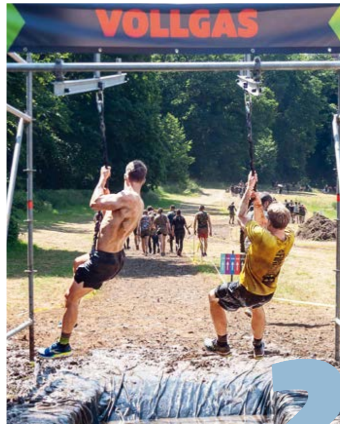
Fotos: Tim Wegner / Anna-Kristina Bauer (2) / privat / Mud Masters Cover: Anna-Kristina Bauer