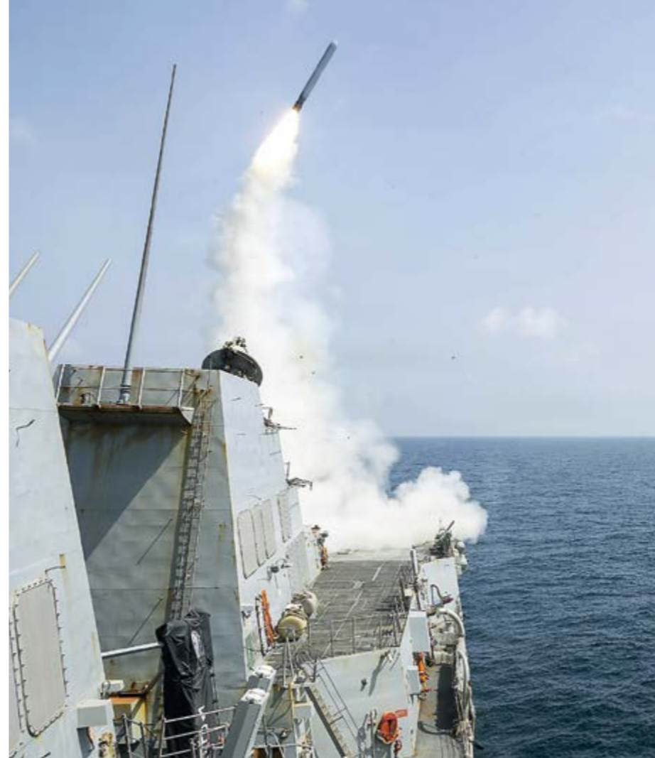
Ein Schiff der US-Marine schießt im Februar einen Tomahawk-Marschflugkörper Richtung Iran

Die App für Reservisten mit dem Namen „ Meine Reserve “ funktioniert schlecht, sorgt für Verärgerung, berichtet die „FAZ“. Die Registrierung dauert manchmal Wochen, die App steckt voller Fehler. Bei Google bekommt sie nur 1,5 Sterne. Dabei steckt ein zweistelliges Millionenbudget dahinter, um Nutzern die umständliche Kommunikation per Post zu ersparen. Eine Förmliche Anerkennung geht an die Reservisten , die ihre positiven Erfahrungen mit der App teilen. Denn irgendwas wird doch wohl funktionieren!