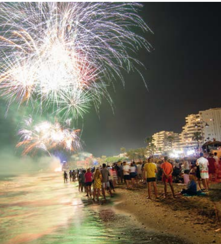
Wer Lust auf Party hat, ist am Strand von Arroyo de la Miel in Spanien genau richtig

Am 24. Juni wird das Johannisfest gefeiert – und die Sommersonnenwende. Diese Spektakel in Europa sind eine Reise wert