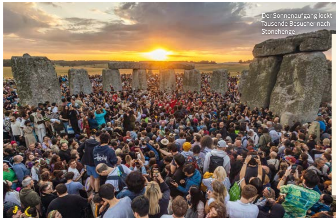
Der Sonnenaufgang lockt Tausende Besucher nach Stonehenge

Früher tanzten die Menschen um die Feuer und sprangen über sie hinweg. Der Sprung sollte Unheil abwenden und von Krankheiten reinigen. Symbolisch steht die Johannisnacht für Vergänglichkeit: Auf dem Höhepunkt des Lebens kündigt sich auch das Ende an. Christinnen und Christen richten ihre Hoffnung dabei auf Jesus, von dem sie glauben, dass er den Tod überwunden hat.